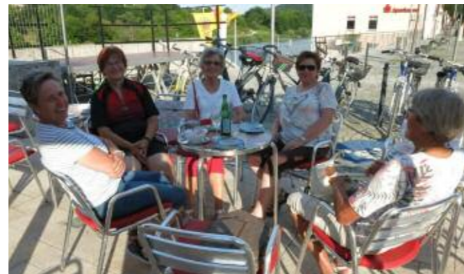
Radltour nach Riedenburg

Vor der Sommerpause traf sich eine kleine Gruppe zu einer Radltour. Vom Sportplatz in Altessing ging es am Kanal entlang nach Riedenburg zum Eis essen. Anschließend fuhren wir wieder zurück zum Sportplatz, wo wir unseren Ausflug auf dem Sommerfest der Sportfreunde ausklingen ließen.