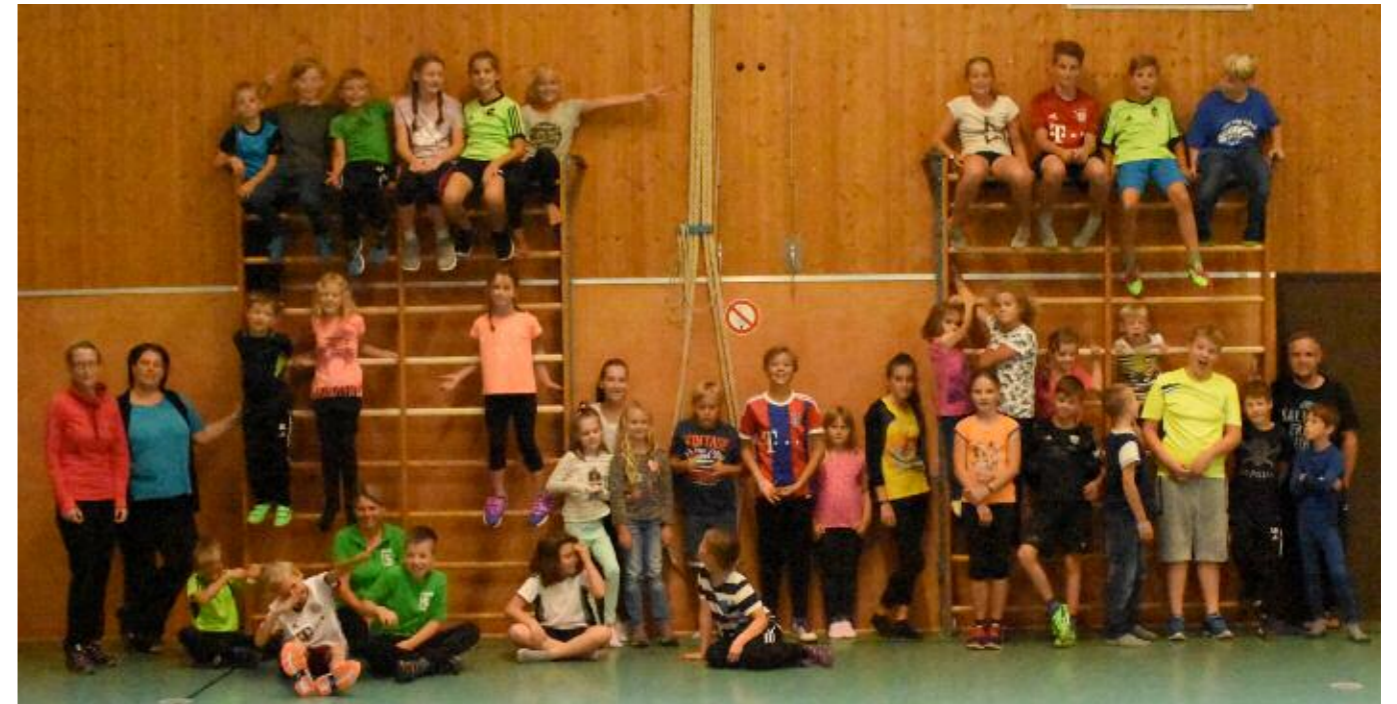
Die Teilnehmer des Ferienprogramms beim Sportverein

dabei eine kleine Fangemeinde die die beiden seelisch unterstützten.